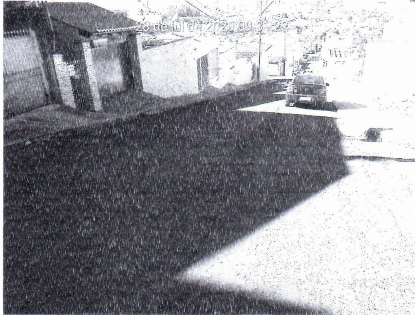
Figura 04: Inconformidades no estado atual da pavimentação asfáltica da Rua Três Continentes, no bairro Jardim América.

Após realização de vistoria, retorno os autos para ciência.