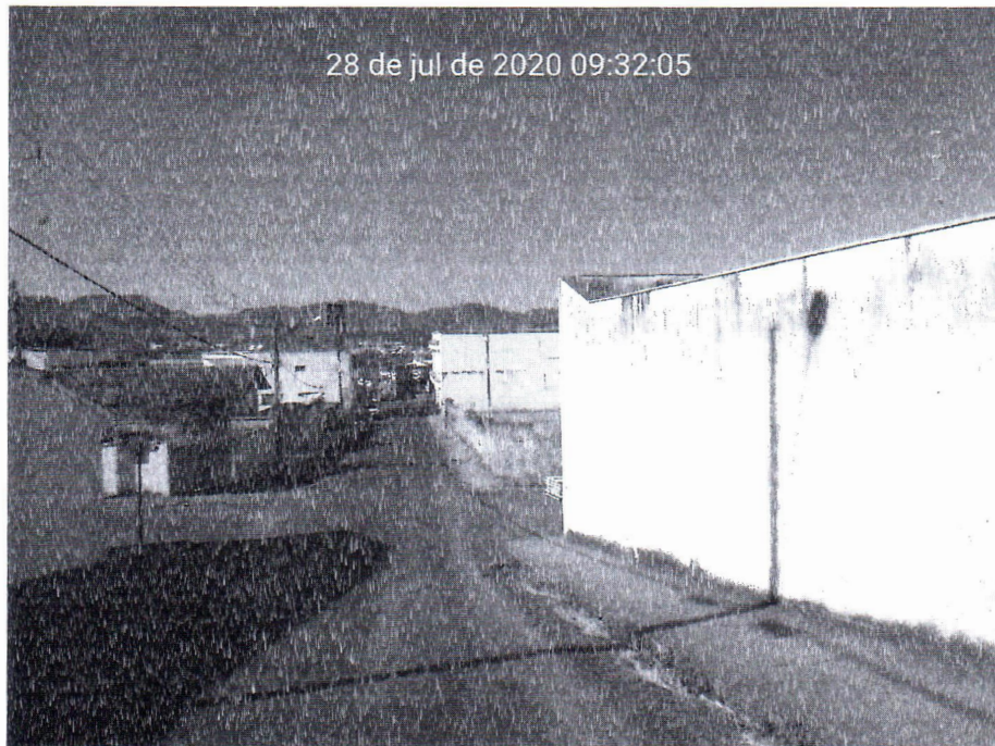
Figura 03: Inconformidades no estado atual da pavimentação asfáltica da Rua Três Continentes, no bairro Jardim América.