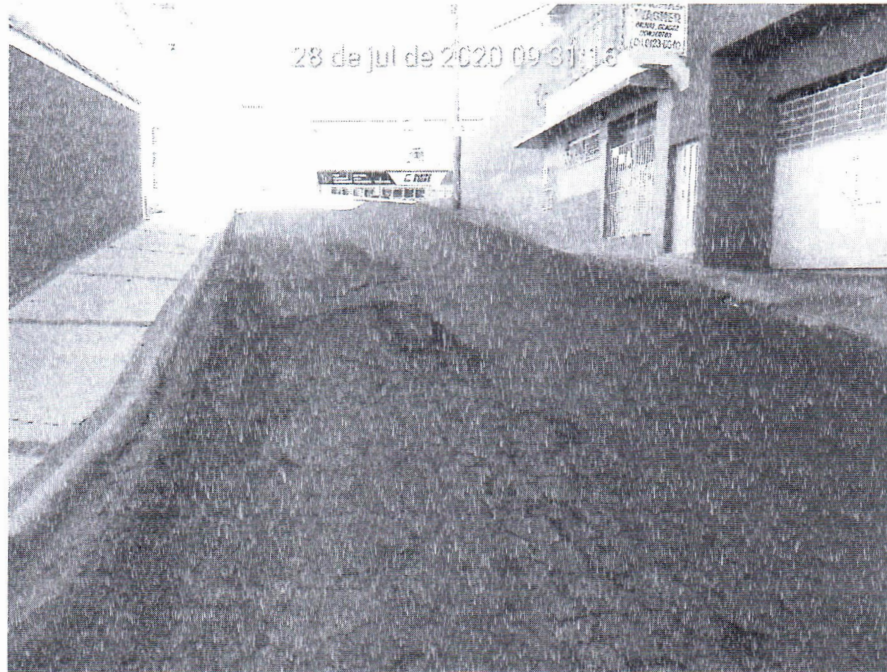
Figura 02: Inconformidades no estado atual da pavimentação asfáltica da Rua Três Continentes, no bairro Jardim América.