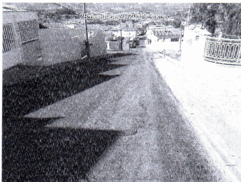
Figura 01: Inconformidades no estado atual da pavimentação asfáltica da Rua Três Continentes, no bairro Jardim América.

Abaixo estão inseridas fotos registradas durante a realização da vistoria e que elucidam o que foi relatado acima.