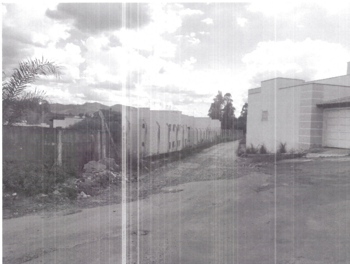
Foto da antiga estrada que de acesso ao pesqueiro Iapesque