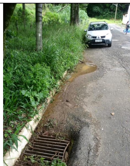
Extravasamento para a boca de lobo.