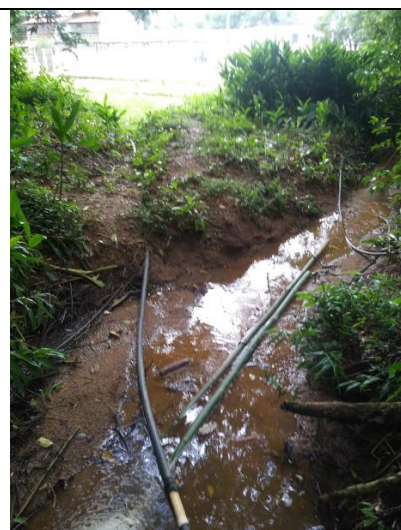
(à esq.: tubo que alimenta o lago; à dir.: sobra, contorna o lago).