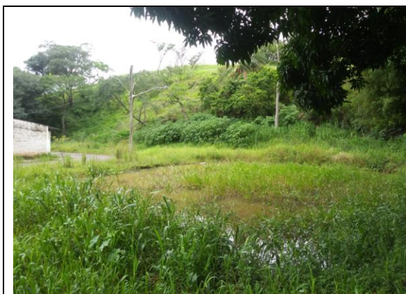
Presença de grande quantidade de gramíneas dentro do lago.