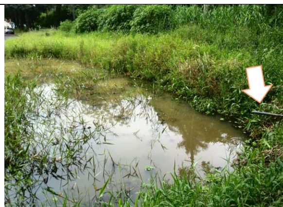
Tubulação de alimentação sem água corrente (possivelmente entupida).