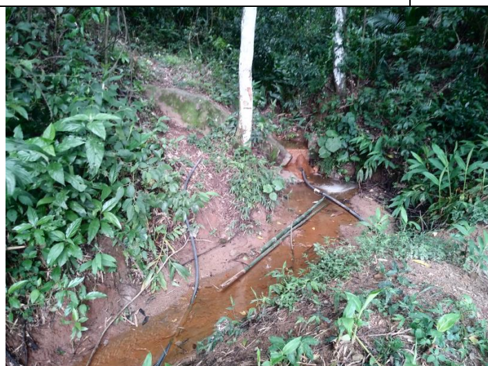
Divisão do escoamento da água (à esq.: sobra, contorna o lago; à dir.: tubulação que alimenta o lago).