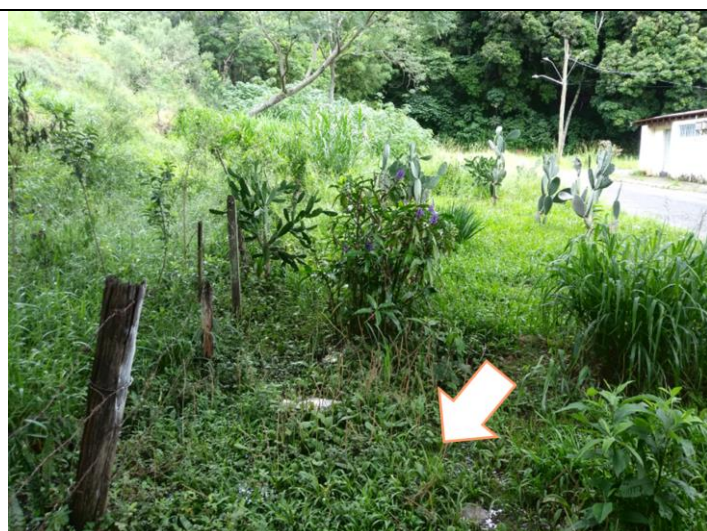
Sobra da água espalhando sobre terreno próximo.