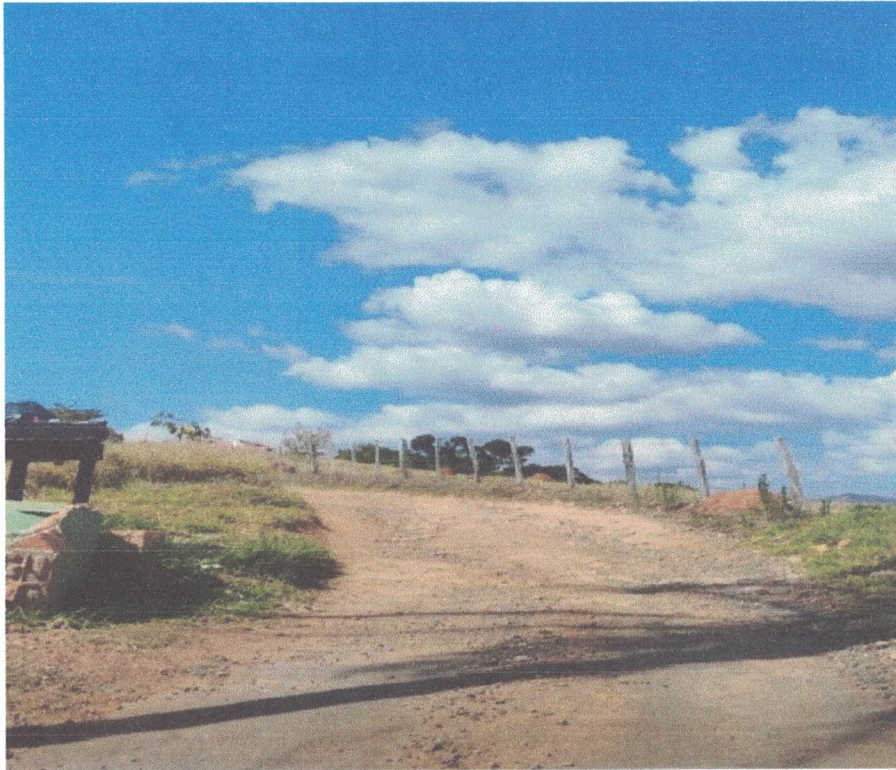
Foto 4: Rua Paulino Rosa – Bairro da Sóvis (Jardim Mirante) Entrada Comunidade Terapêutica Caverna de Adulão