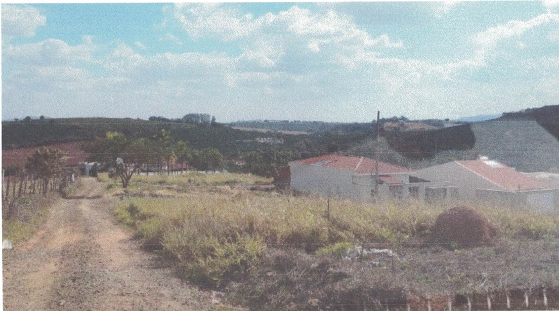
Legenda Foto 3: Rua Paulino Rosa – Bairro da Sóvis (Jardim Mirante)