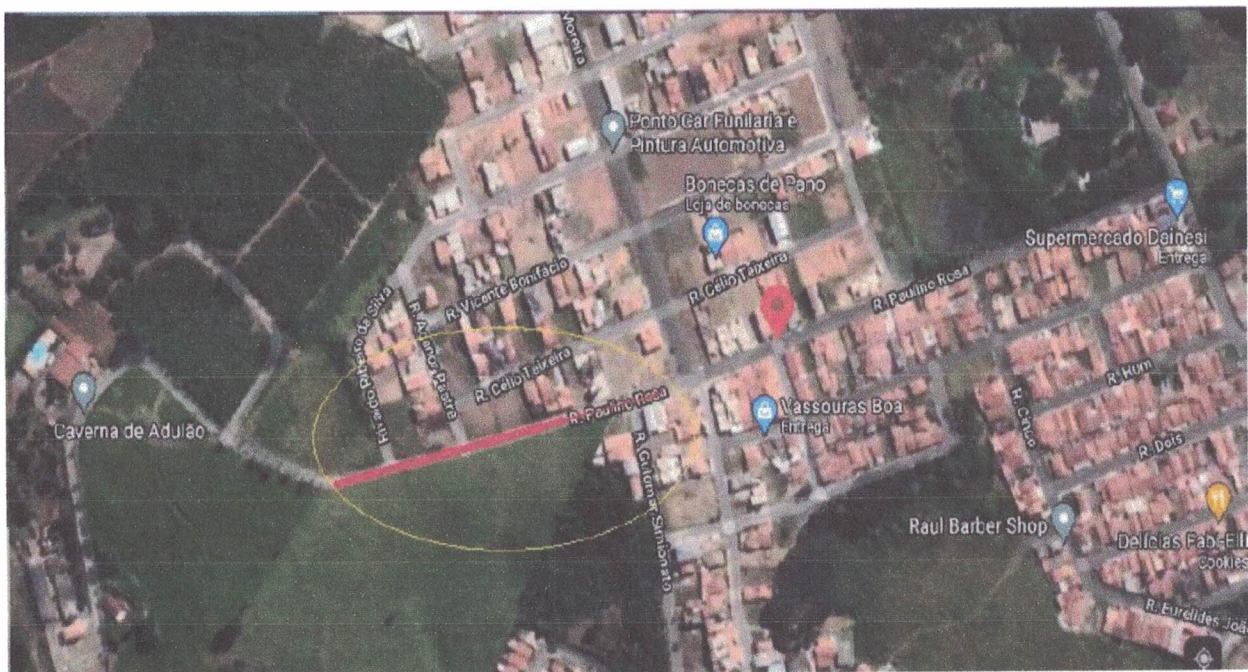
Legenda: Mapa – Rua Paulino Rosa - Jardim da Sóvis – Andradas – MG