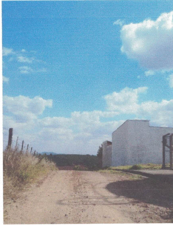
Legenda Foto 2: Rua Paulino Rosa – Bairro da Sóvis (Jardim Mirante)